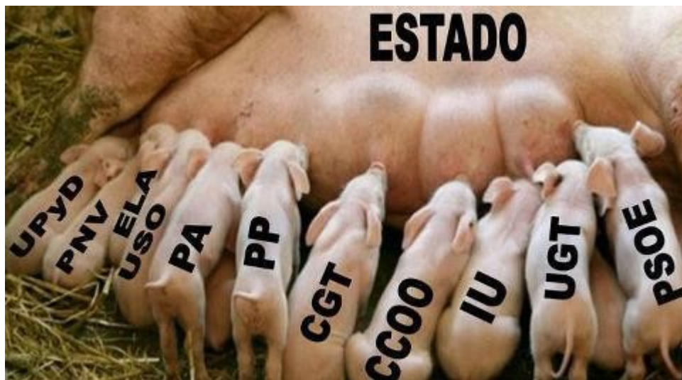
AHORA MAMAN BENEFICIANDOSE DEL ATENTADO A LA CNT

EL GENIO DEL ARTE TOTEM CESAR MANRIQUE VENERADO POR TODO POLITICO CANARIO HA TENIDO UN PASADO MUY OSURO